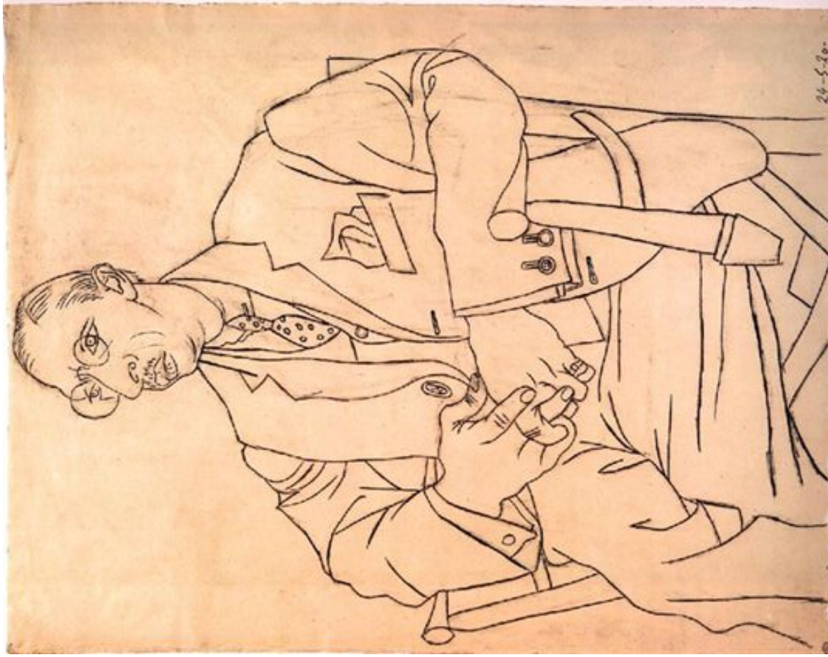
Pablo Picasso, Portrait of Igor Stravinsky , 1920 Пабло Пикасо, Портрет Игора Стравинског, 1920